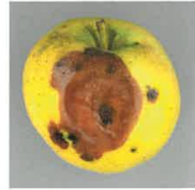
Black Rot ( Diplodia seriata ).