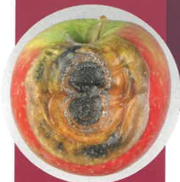
Pourriture au verger (variété Cripps Red).