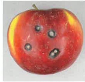
Anthraxose de la pomme, due à Elsinoe pyri .