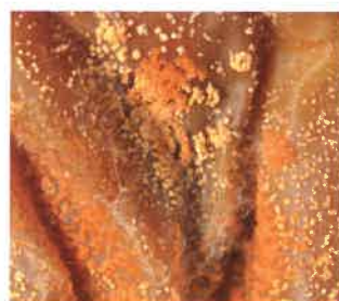
Fructifications sur une nécrose.