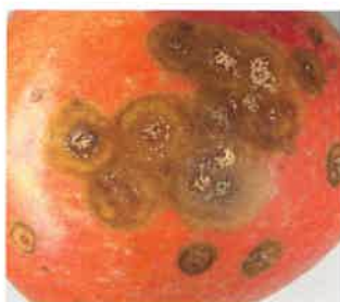
Nombreuses taches, plus fréquentes en conservation.

peut être totale dans les cas les plus graves. En conservation, les symptômes sont similaires, mais au départ ils ressemblent davantage aux gloeosporioses classiques dues à Neofabraea alba (voir Fiche bioagresseur d'avril 2015) et semblent apparaître un peu plus tôt. Alors que cette dernière montre souvent une partie centrale plus claire, Colletotrichum a toujours la zone centrale qui devient sombre, puis rose-orangée.